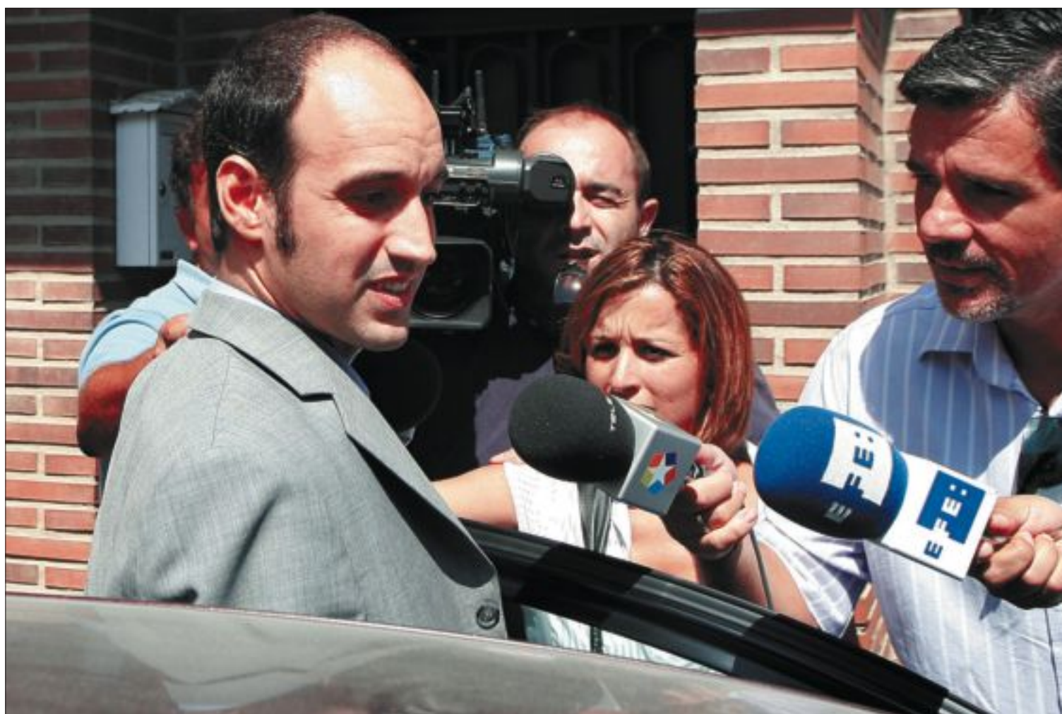
El director de la sucursal bancaria de Torrejón de Velasco, tras ser liberado por los secuestradores.

Y es que el anterior robo se produjo apenas 24 horas antes, cuando unos aluniceiros intentaron robar en un concesionario de venta y reparación de vehículos Mercedes, en el número 38 de la misma calle. Los atracadores empotraron un Audi contra la puerta del taller, de chapa metálica. El plan falló, pero consiguieron huir en el mismo vehículo antes de que llegaran los agentes de la policía. Este taller está situado apenas a 200 metros del concesionario Jaguar atracado el pasado 22 de julio.