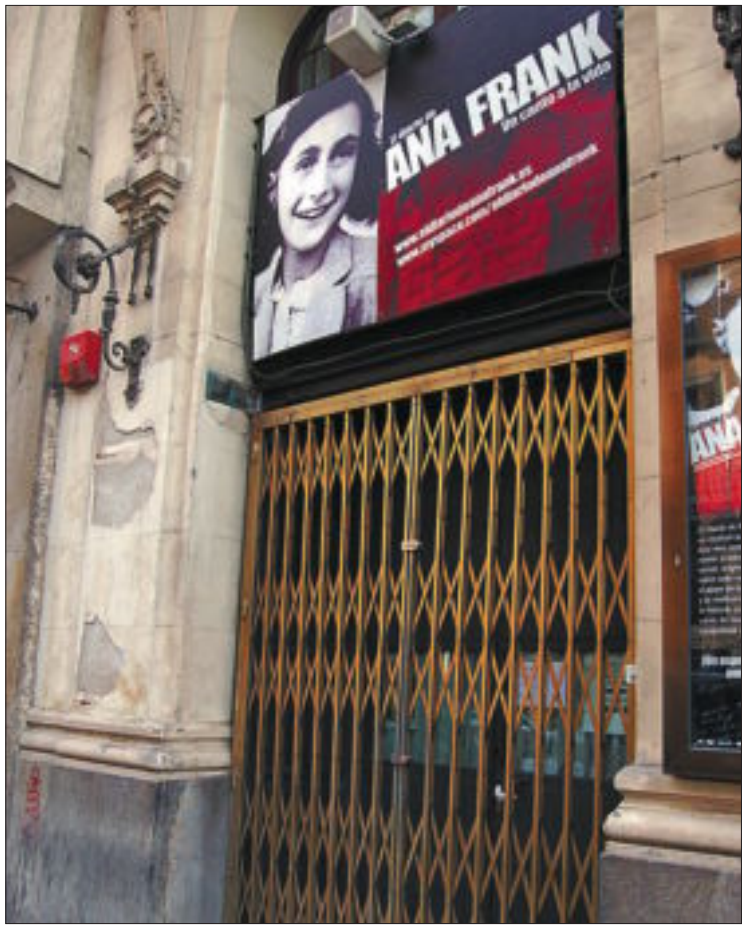
Puerta de entrada de los actores al teatro Calderón, cerrada ayer.